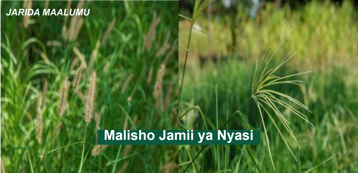
Malisho Jamii ya Nyasi