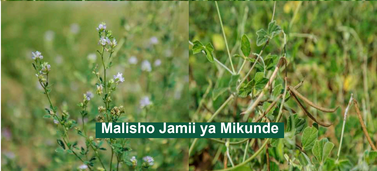
Malisho Jamii ya Mikunde