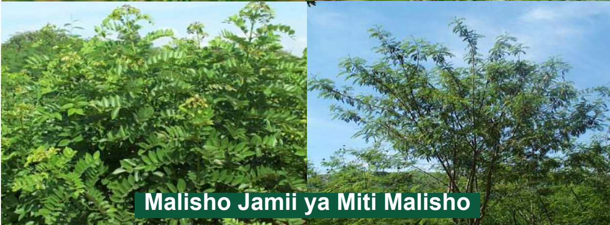
Malisho Jamii ya Miti Malisho