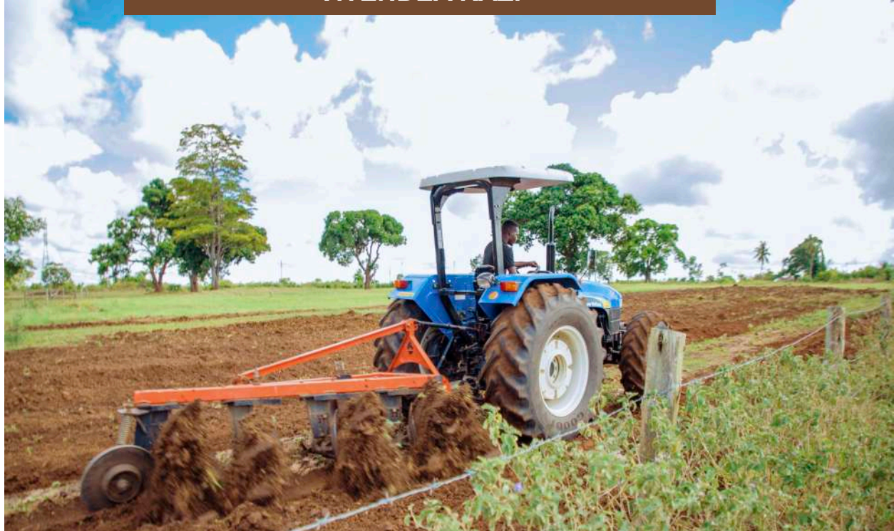
Tembelea Tovuti ya Taasisi Kusoma Jarida Hili ( www.taliri.go.tz )